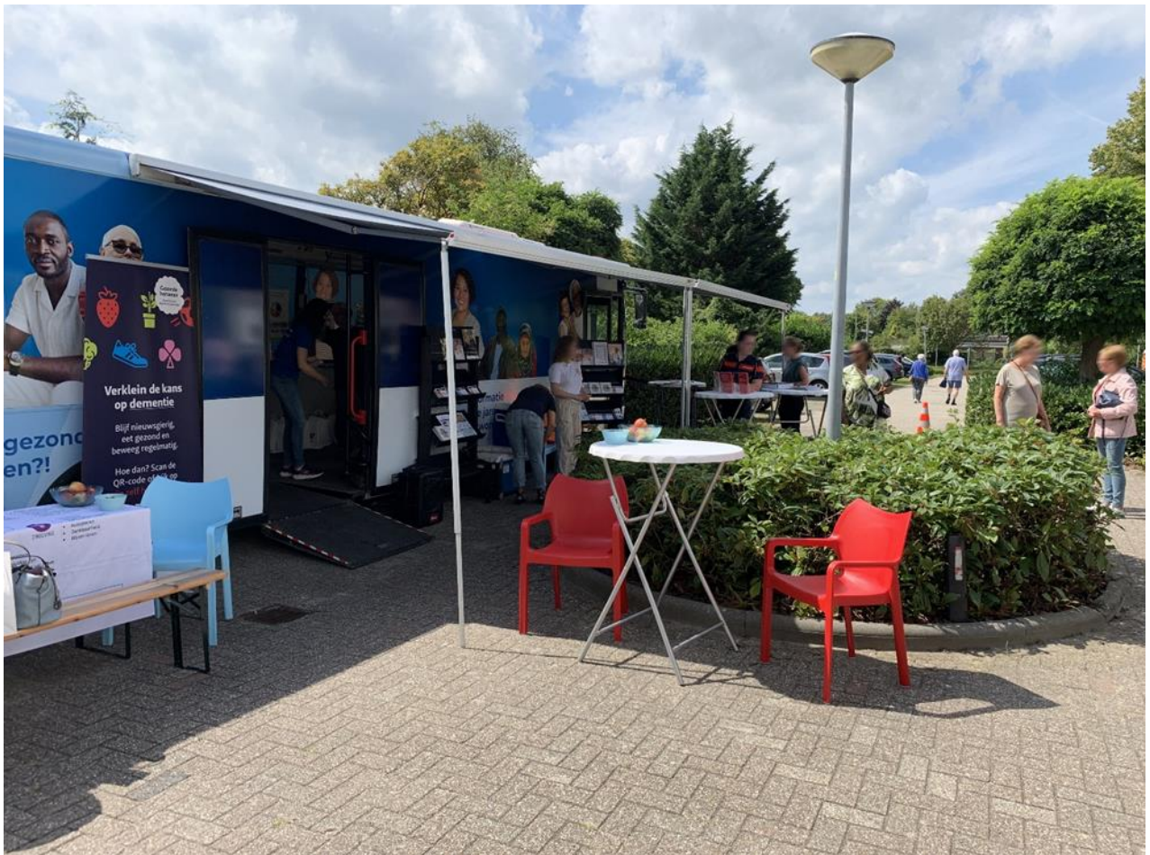
De GGD-bus stond bij de Petruskerk op 7 en 14 augustus.